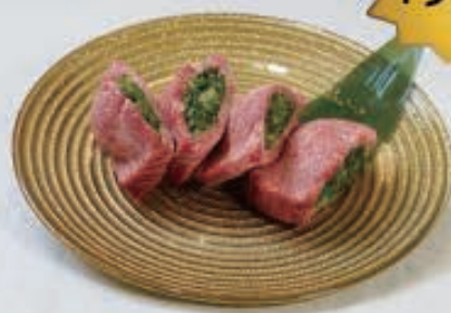
京や厚切りネギタン 1,600円(税込1,760円)