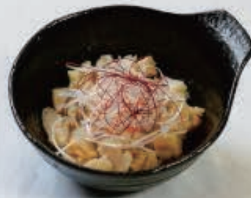
ミノユッケ 750円(税込 825円)