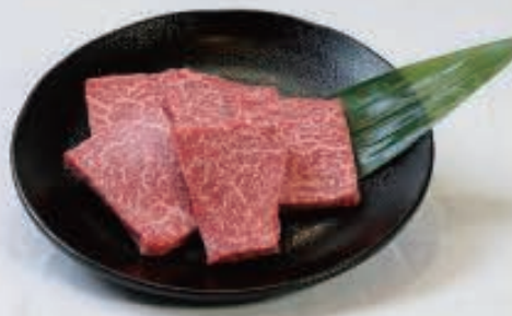
上ロース 1,200円(税込1,320円)