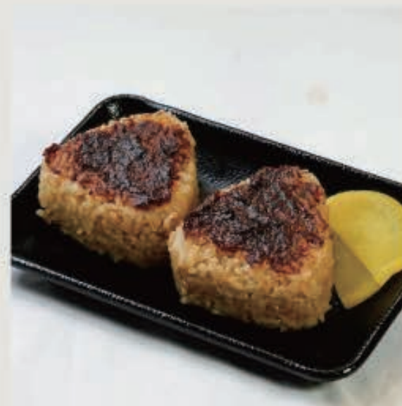
味噌焼きおにぎり