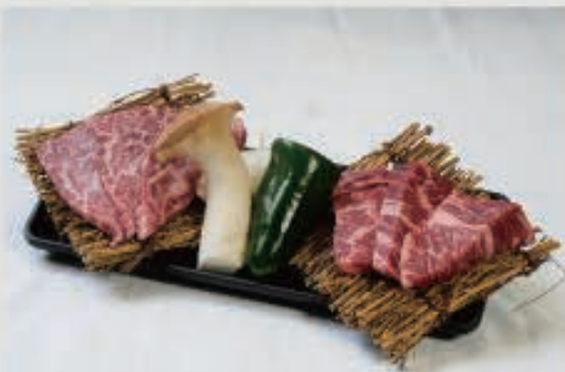
赤身二種盛り 2,100円(税込2,310円)