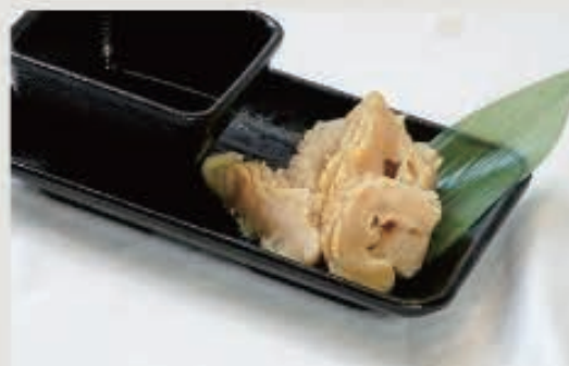
上ミノ湯引き 830円(税込 913円)