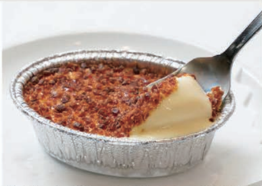
クレームブリュレ風カスタードアイス