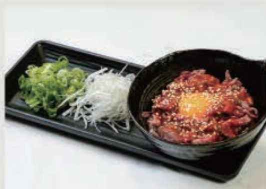
特選黒毛和牛炙りユッケ 1,000円(税込 1,100円)