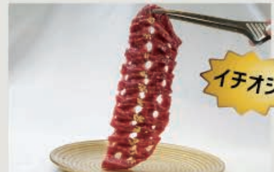
すだれロース 2,400円(税込2,640円)