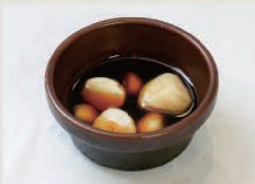
青森産にんにくオイル焼き 450円(税込 495円)