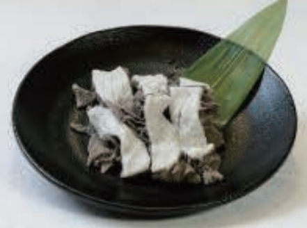
センマイ 720円(税込 792円)