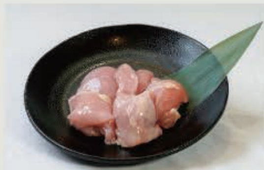
阿波鳥もも 550 円(税込 605 円)