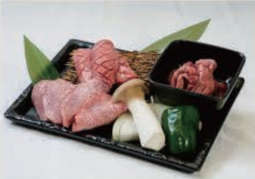
牛タン三種盛り 2,000円(税込2,200円)