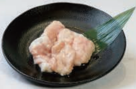
ホソ 720円(税込 792円)