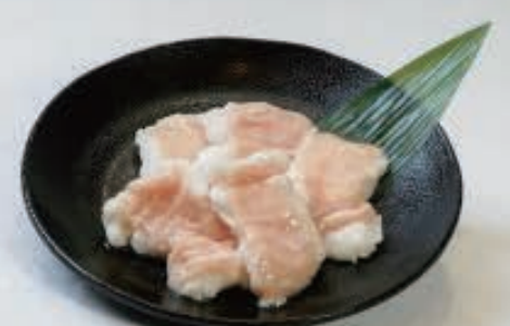
テツチャン 750円(税込 825円)