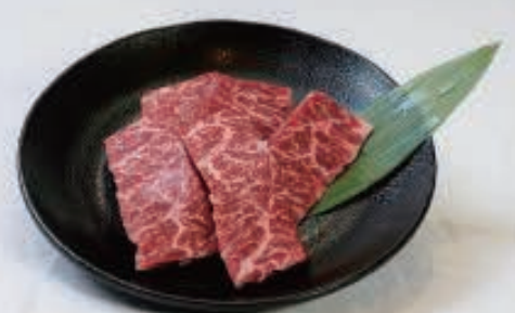
上ハラミ 1,200円(税込1,320円)