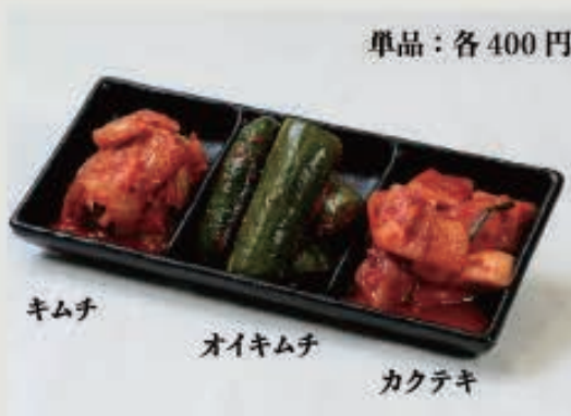
キムチ盛り合わせ 600円(税込 660円)