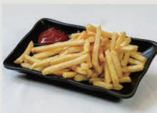
フライドポテト 290円(税込 319円)