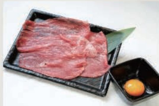
特選黒毛和牛モモ焼きシャブ 910 円(税込 1,000 円)