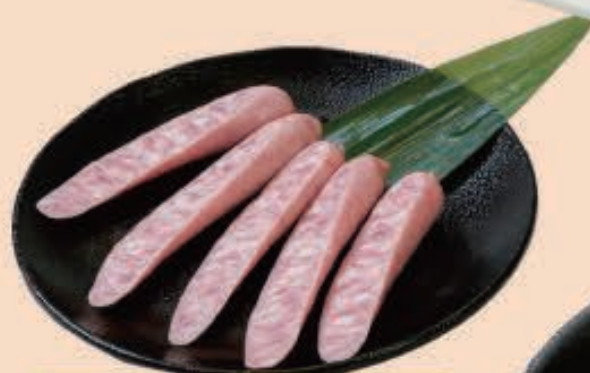
ウィンナー ¥500 (税込 ¥550)