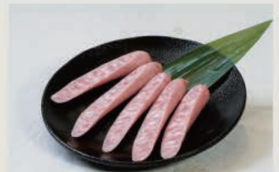
ウィンナー 500 円(税込 550 円)