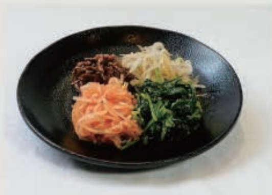
ナムル盛り合わせ 540円(税込 594円)