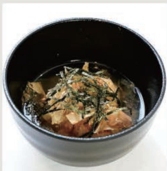
焼きおにぎり茶漬け