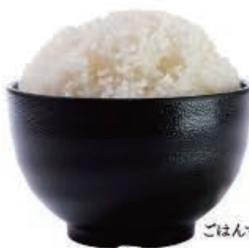
ごはんマンガ盛り