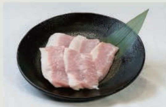
豚トロ 550 円(税込 605 円)