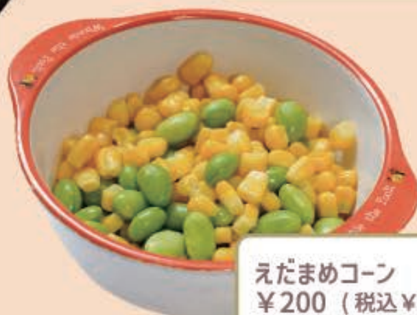
えだまめコーン ¥200 (税込 ¥220)