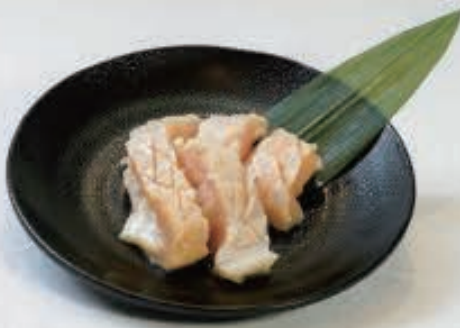
ミノ 820円(税込 902円)