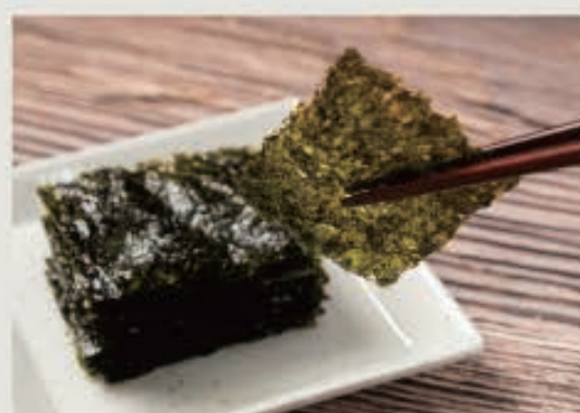
韓国のり 200円(税込 220円)