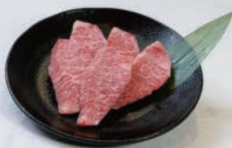
上カルビ 1,200円(税込1,320円)