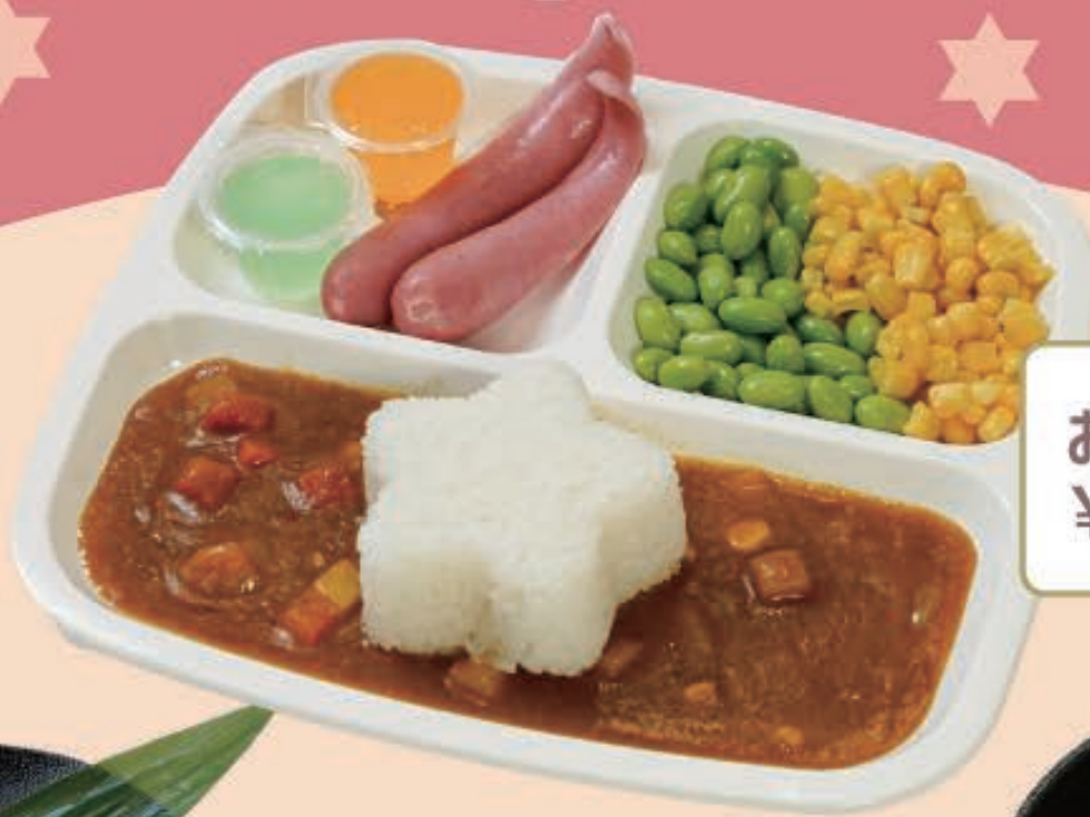
おこさまランチ ¥450 (税込 ¥495)