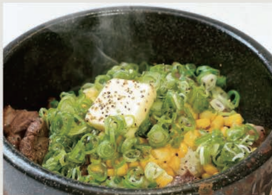
石焼ビーフライス