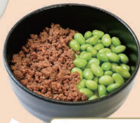
そぼろえだまめごはん ¥300 (税込 ¥330)