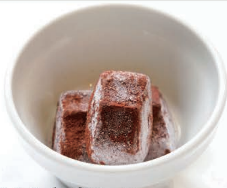
アイス de 生チョコ