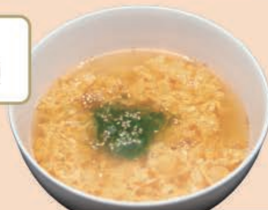
おこさまたまごスープ ¥200 (税込 ¥220)