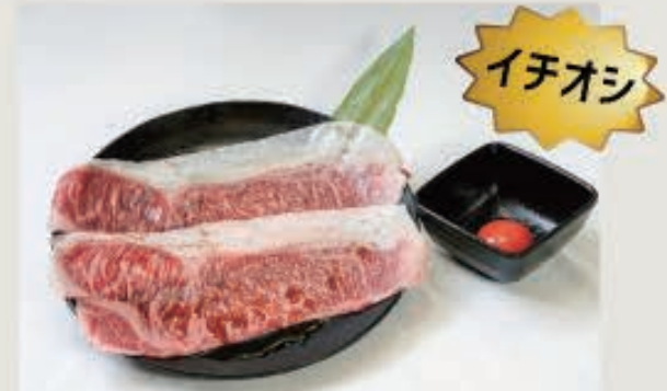
特選黒毛和牛桐原焼き 1,800 円(税込 1,980 円)