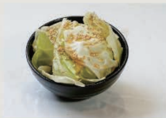
塩キャベツ 360円(税込 396円)