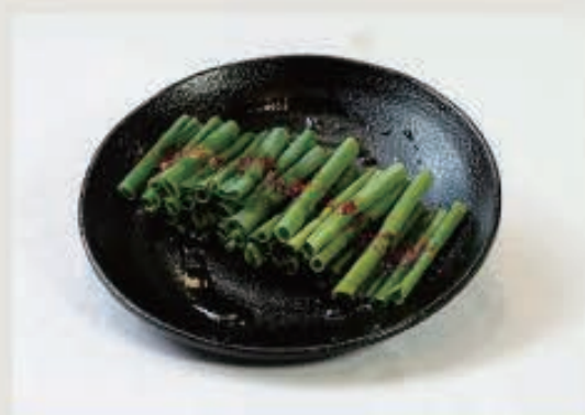
韓国ねぎあえ 310円(税込 341円)