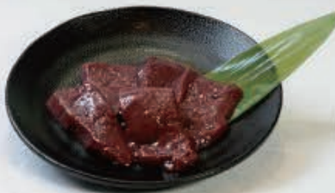
レバー 750円(税込 825円)