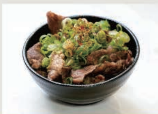
牛すじネギポン酢 500円(税込 550円)