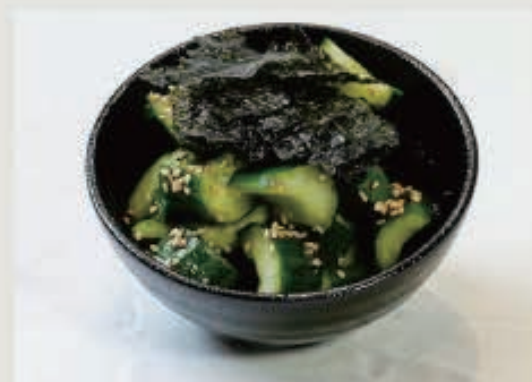
塩きゅうり 310円(税込 341円)