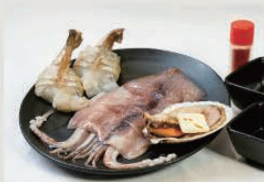
海鮮セット 1,800 円(税込 1,980 円)