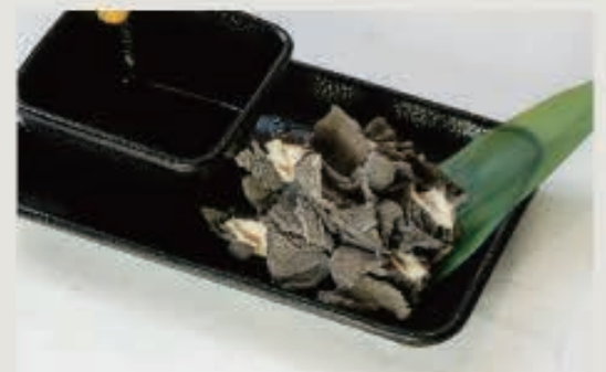
センマイ湯引き 730円(税込 803円)