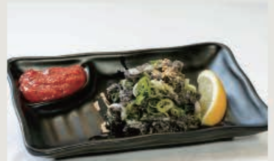
センマイ刺し 780円(税込 858円)