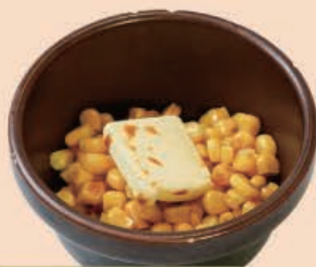
コーンバター ¥310 (税込 ¥341)