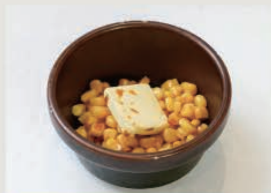
コーンバター 310円(税込 341円)