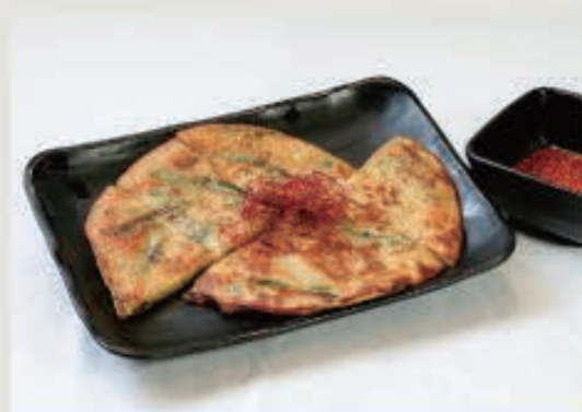
チヂミ 630円(税込 693円)