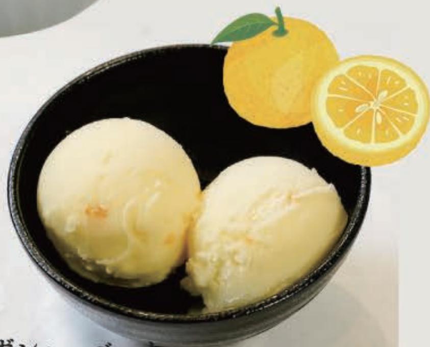
ゆずシャーベット