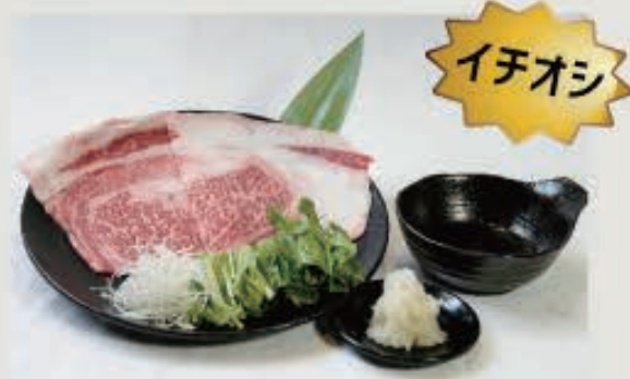
リブローズ焼きシャブ 1,100 円(税込 1,210 円)