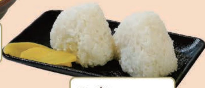
おにぎり ¥310 (税込 ¥341)