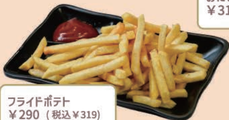
フライドポテト ¥290 (税込 ¥319)