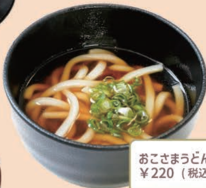
おこさまうどん ¥220 (税込 ¥242)