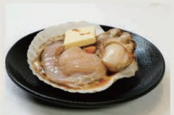
ホタテ 600 円(税込 660 円)