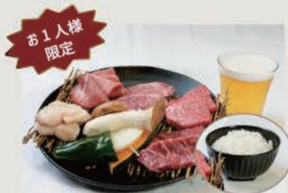
1人焼肉セット 2,200円(税込2,420円)