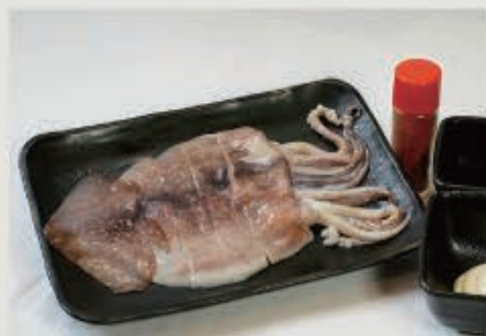
イカ一夜干し 720 円(税込 792 円)