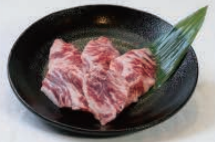
中落ちカルビ 880円(税込968円)