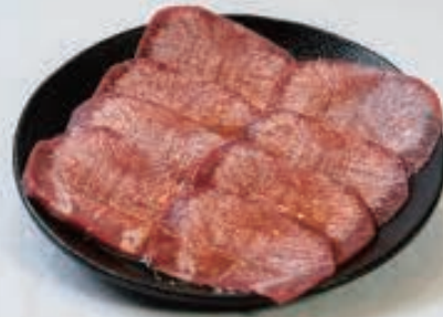
上タン(タレ) 1,100円(税込1,210円)