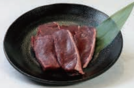
スマ(心臓) 670円(税込 737円)